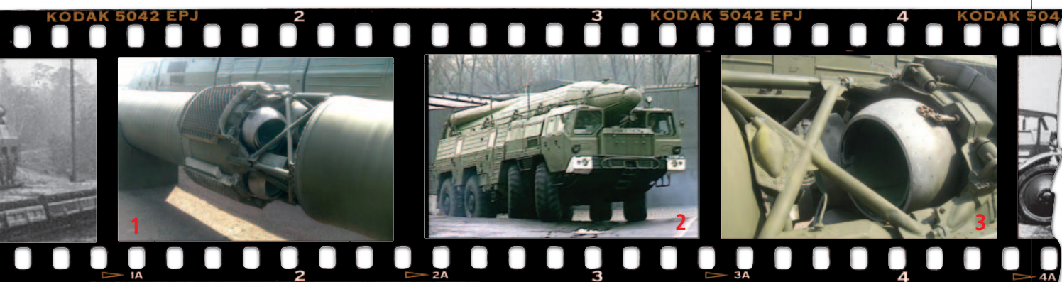
1. Raketa 9M76 – detail spojení 1. a 2. stupně 2. Odpalovací zařízení 9P120 systému Temp-S na nádvoří kasáren v Hranicích n/Moravě 3. Raketa 9M76 - detail trysky 2. stupně

V únoru 1997 důstojník kubánské armády A. Prendez, který přeběhl do USA, vypověděl, že Kuba údajně obdržela ze SSSR na začátku 90. let pět kompletů SS-12 určených pro útok vyvíjenými biologickými zbraněmi. Systém měl být dislokován v oblasti města Santa Clara. Nicméně tato informace byla vyhodnocena jako nevěrohodná.