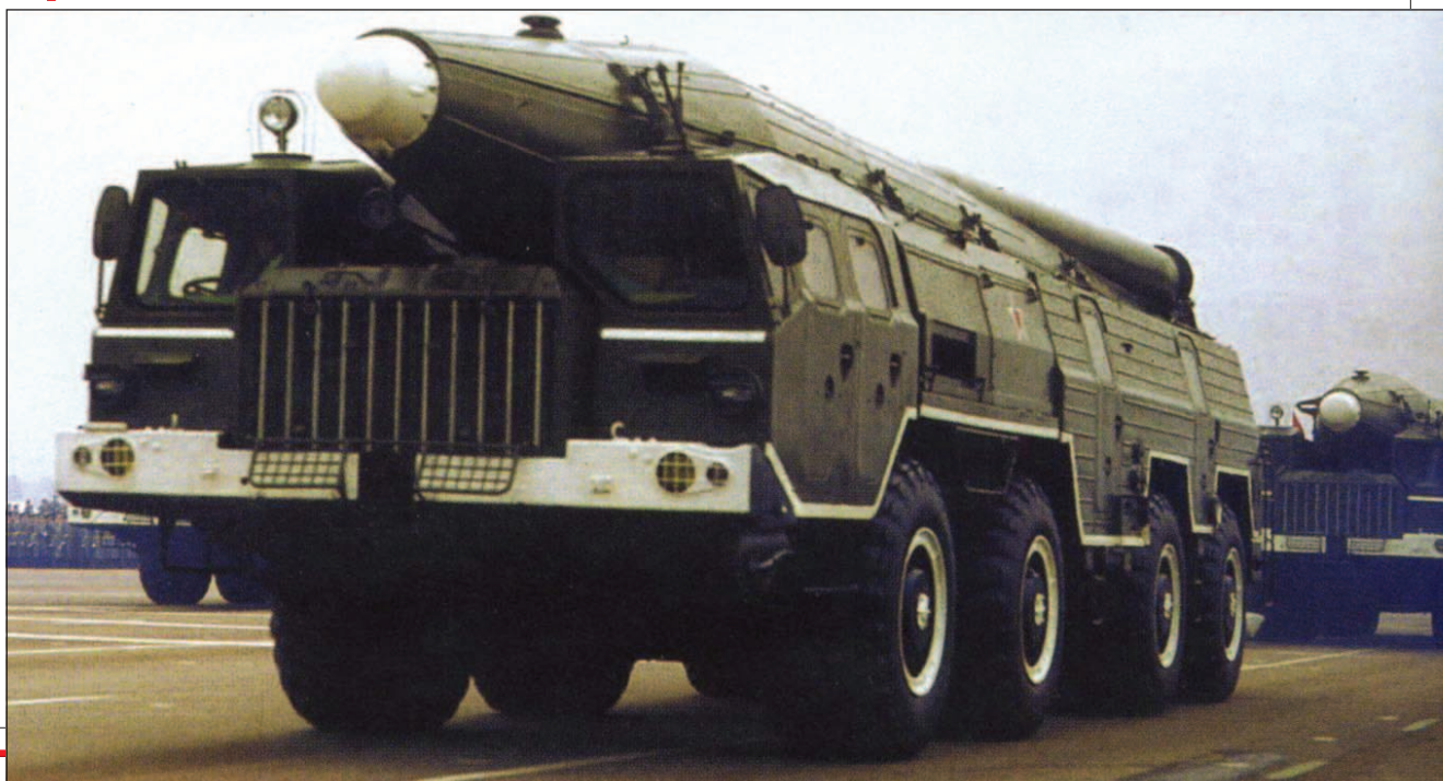
Odpalovací zařízení Temp-S (SS-12) z výzbroje Moskevského vojenského okruhu (samostatný raketový oddíl v městě Šuja) během přehlídky na Rudém náměstí v Moskvě

Na začátku 70. let byla z arsenálů stažena chemická hlavice Tuman-2 jako zastaralá. Současně probíhala postupná modernizace řídicího a navigačního systému rakety, která na začátku 80. let vedla ke zlepšení taktických parametrů rakety, hl. přesnosti zásahu. Po zavedení radarového (optického ?) navedení v poslední fázi letu byla přesnost navedení na cíl v rozmezí 50–150 m. Tyto modernizované rakety označované 9M76B byly zřejmě vyráběny od roku 1984, ale není jas-