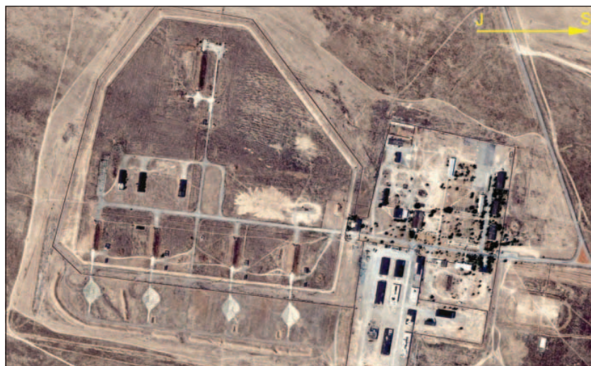
Satelitní snímek bývalého postavení systému Temp-S (samostatný raketový oddíl) u Kattakurganu (Uzbekistán). Jednotka v 80. letech držela bojovou pohotovost pro případ raketové podpory sovětského kontingentu v Afghánistánu.

V průběhu vojenského nasazení raketa prodělala několik technických zlepšení, jež vedla ke kvalitativnímu posunu taktických vlastností. Na začátku 80. let byl Temp-S rozmístěn v 7 vojenských okruzích SSSR v počtu jedné raketové brigády, kromě nich působily ještě 4 samostatné raketové oddíly. Později se systém Temp-S stal mj. nástrojem tzv. odvratných opatření vůči NATO jako reakce na rozmístování moderních amerických raket středního doletu MGM-31C Perhing II (NSR) a střel s plochou dráhou letu BGM-109G Gryphon (Velká Británie, NSR, Itálie, Holandsko a Belgie). V rámci této protiakce přemístil SSSR do střední Evropy na přelomu let 1983/84 mj. tři raketové brigády Temp-S (2 do NDR a 1 do Československa), které držely nepřetržitou bojovou pohotovost.