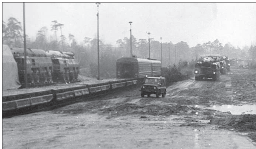
Prostředky systému Temp-S v přípravě k železničnímu transportu

45 km/hod, rozsah venkovní teploty pro použití jeřábu od - 40°C do + 50°C, max. rychlost větru při práci 15 m/s (v poryvech do 20 m/s), obsluha 3 osoby.