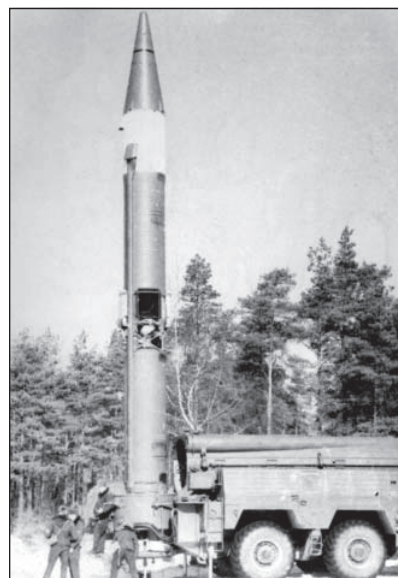
Systém Temp-S připraven k odpálení rakety

ší řešení z Temp-2S byla uplatněna při vývoji dalšího projektu MIT, mobilního raketového systému středního doletu na TPH, pověstného SS-20 Saber (Pioněr, 15Ž45, RSD-10), který byl rozmístován od 1976 výhradně na sovětském území, a jenž byl obdobně jako systém Temp-S zlikvidován na základě Dohody z 8.12.1987.