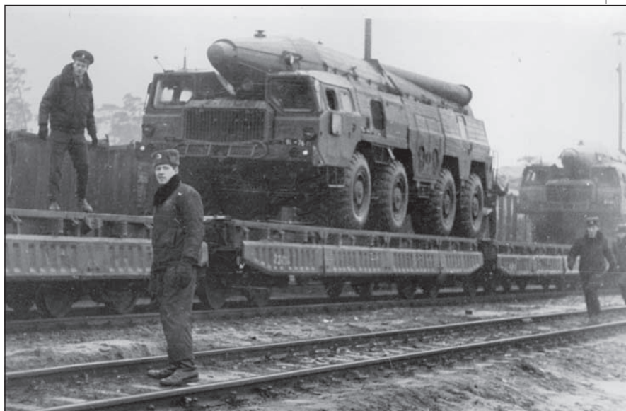
! Dvě odpalovací zařízení 9P120 na vagónech

vodorovné polohy na vozidlo, kde se uzavřel. Současně probíhalo upevnění rakety ve svislé poloze na kruhu vypouštěcího stolu,