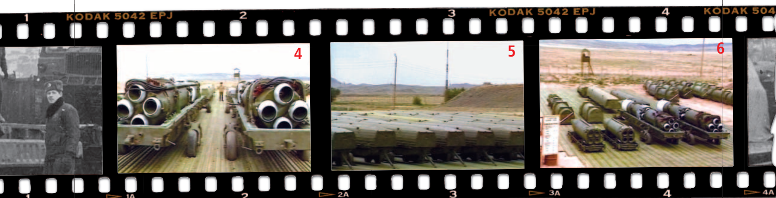
4. Dva raketové nosiče systému Temp-S v otevřeném přepravním kontejneru před likvidací v Saryozeku (srpen 1988) 5. Seřazené kontejnery 9Ja230 s nosiči Temp-S 6. Likvidace nosičů Temp-S a systému Oka