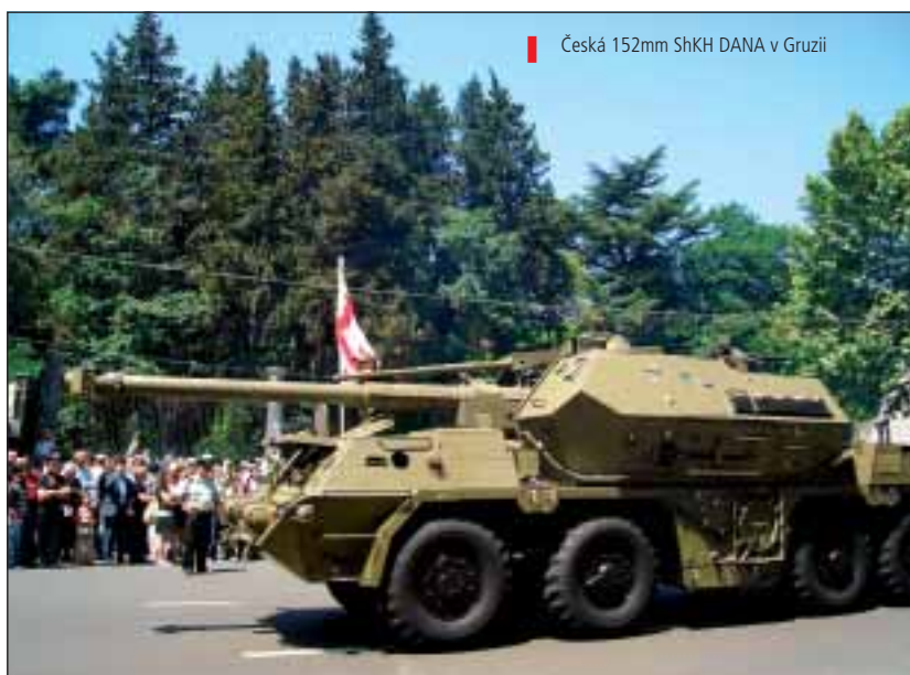
Česká 152mm ShKH DANA v Gruzii

A Česká republika? Před válkou byla v Gruzii vůbec největším zahraničním investorem. Kromě státního podílu v ropovodu Baku-Tbilisi-Ceyhan jen samotná firma Energo-Pro investovala do vodních elektráren a rozvodné soustavy přes půl miliardy dolarů. A navíc – ovšem – z ČR pocházela velká část výzbroje