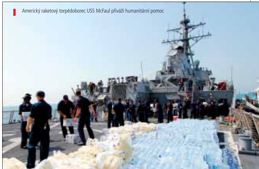
Americký raketový torpédoborec USS McFaul přiváží humanitární pomoc

ozbrojený zásah v Jižní Osetii tolerovat nebude. Saakašvili měl zjevně za to, že Rusové blafují – a nakonec, jako již tolikrát od rozpadu SSSR, ustoupí. Kdyby výchozí předpoklady byly jiné a s ruským zásahem se počítalo, byl by gruzínský štáb musel vyčlenit podstatnou část sil, aby nejprve obešla Cхинvali a zablo-