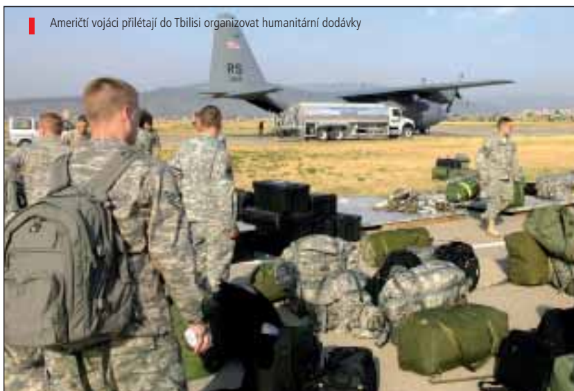
Američtí vojáci přilétají do Tbilisi organizovat humanitární dodávky

kovala Rokský tunel. Obsazení města mohlo počkat, kdežto zablokování tunelu mělo jasnou prioritu. O částečné rozbití výstupu z tunelu se ostatně mohlo pokusit i gruzínské letectvo, vezmeme-li v úvahu maximální užitečný náklad robustních Su-25. Ani to se nestalo. Masivní dělostřelecká příprava útoku na sídelní aglomeraci, kromě toho, že porušila mezinárodní válečné právo a poskytla Moskvě vynikající záminku k zásahu, navíc také signalizovala protivníkovi zahájení útoku a poskytla mu čas k reakci. Jednotky gruzínské armády fakticky uvízly v bojích o Cchinvali a proti Rusům vyjždějícím z tunelu použily kazetovou munici, zjevně nepřilíš úspěšně. Pokus s částí sil obejít město z východu byl zastaven jen několik kilometrů severoseverozápadně od něj přicházejícími ruskými jednotkami, které vjely do tunelu Roki zhruba čtyřicet minut poté, co se dali do pohybu Gruzínci. V ten okamžik byla válka prohrána a dovršení porážky se stalo pouze otázkou času.