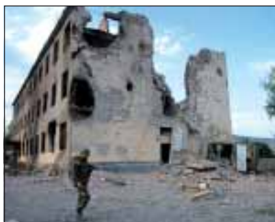
Kasárna ruských mírových sil v Cхинvali po gruzínském útoku

Proti komu Gruzie zbrojila? Příznivci Saakašviliho, včetně zástupců českého Člově-