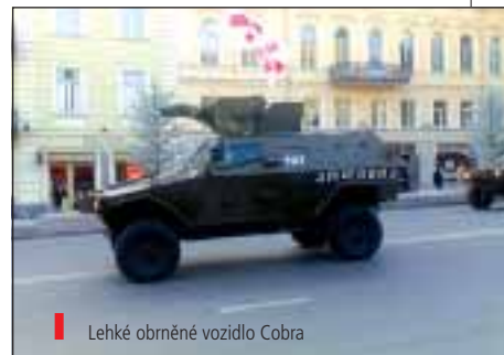
Lehké obrněné vozidlo Cobra

Jestliže Polsko, pobaltské země a Ukrajina nabraly prakticky stejný kurs jako americké neokonzervativní elity, další ze států původně podporujících Saakašviliho, Izrael, naopak usiluje o obnovení korektních vztahů s Moskvou a od USA se zřetelně vzdaluje. Izraelci doufají, že se jim podaří omezit rozsah obnovované vojenské spolupráce Ruska se Sýrií, která by mohla narušit strategickou rovnováhu v regionu. Jestliže se jim to nepodaří, sníží se šance ministryně zahraničí Cipi Livni na premiérské křeslo – a tím i šance na uzavření mírové dohody s Palestinci.