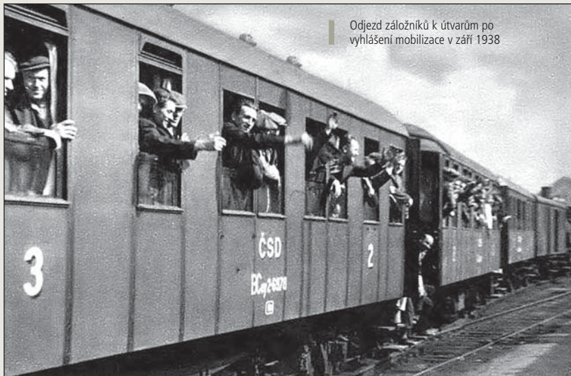
Odjezd záložníků k útvarům po vyhlášení mobilizace v září 1938

Rozbuškou dalších událostí se stal projev A. Hitlera na sjezdu NSDAP v Norimberku v noci 12. září 1938. Ve své řeči Hitler otevřeně vyhrožoval československé vládě i prezidentu Benešovi. Afektovaně líčil útlík německé menšiny v československém pohraničí a vyhrožoval, že pokud nebudou splněny všechny požadavky henleinovců, bude Německo nuceno vojensky zasáhnout. Okamžitě po skončení Hitlerova projevu vypukly v celém pohraničí masové demonstrace, které rychle přerostly v ozbrojené povstání proti Československu. V průběhu 13. září 1938 došlo k mnoha útokům na český a židovský majetek, úřady a další objekty. Množily se případy četnických a policejních služeben či nádraží. Při těchto akcích bylo zraněno či zabito několik příslušníků československých ozbrojených sil (zejména četníků), zahynulo ovšem i několik členů FS.