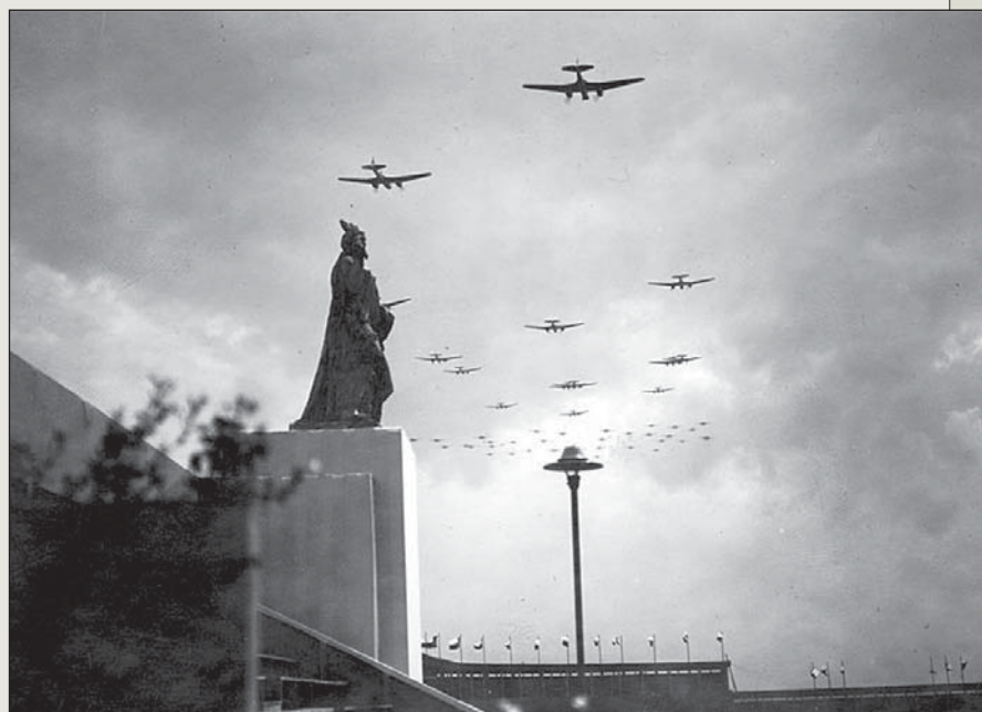
■ Přelét moderních bombardérů B.71 nad Strahovským stadionem při X. všesokolském sletu demonstroval sílu našeho letectva.

Na sletu se značnou měrou podílela i československá armáda. Kromě vystoupení vojáků na Strahovském stadionu se uskutečnila i letecká přehlídka přímo nad stadionem, při které byly mj. představeny i moderní bombardéry B.71 (SB-2 dodané nedávno ze SSSR). Spolu s československými vojáky tehdy na Strahově vystoupili i příslušníci jugoslávské a rumunské armády, kteří demonstrovali spojenectví zemí Malé dohody. Avšak zejména jugoslávská vláda v té době již zcela jasně dávala najevo, že