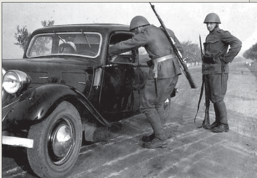
Vojenská hlídka při kontrole osobního automobilu

Také německá armáda se připravovala na možný konflikt. I když její připravenost nebyla o moc vyšší než při nepříteli úspěšném