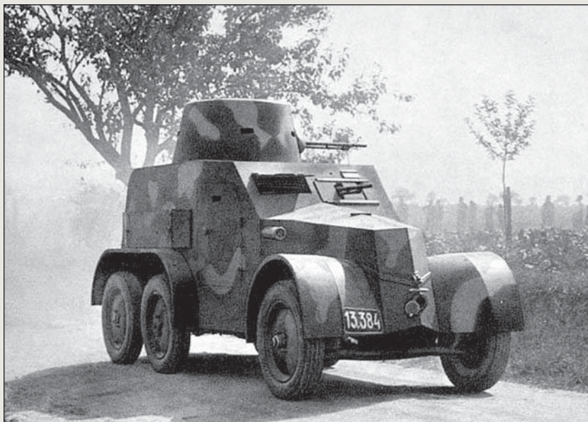
■ V bojích s německým Freikorsem se osvědčily obrněné automobily vz. 30

s delegací velení armády (arm. gen. Krejčí, arm. gen. Prchala, div. gen. Bláha, div. gen. Husárek a div. gen. Luža). Generálové požadovali okamžité vyhlášení všeobecné mobilizace a vyhlášení stanného práva na celém území republiky. Nastávající vnitropolitická krize měla být vyřešena dočasným zřízením vojenské diktatury. Případné vojenské akce měly být vedeny bez ohledu na postoje Francie za předpokládané pomoci SSSR. Beneš však radikální postoje generálů rezolutně odmítl a pouze je vyzval ke schůzce v příhodnějším čase.