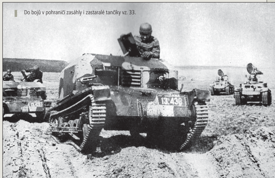
■ Do bojů v pohraničí zasáhly i zastaralé tancůky vz. 33.

Na tento vývoj situace reagovala Syrového vláda okamžitě. Ve 22.50 hodin dne 23. září 1938 vyhlásila na základě paragrafu 57 odst. 1 a odst. 3 branného zákona všeobecnou mobilizaci československé branné moci. Současně byl vyhlášen i stav branné pohotovosti státu. Mobilizační vyhláška zahrnovala 18 ročníků 1. zálohy a náhradní zálohy. Včetně záložníků povolovaných již dříve na různá cvičení se mobilizace týkala přibližně 1 250 000 vojáků. Reakce na vyhlášení všeobecné mobilizace byla mimořádně rychlá. Již několik minut po přečtení vyhlášky v rozhlase se u svých útvarů hlásili první záložníci a v následujících hodinách proud vojáků stále sílil. V průběhu noci převzala armáda ostrahu strategických objektů a jednotky přecházely na válečnou organizaci. Československá republika se usilovně připravovala na obranu své nezávislosti.