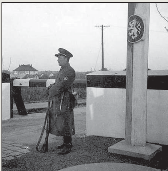
■ Příslušník četnictva u hraničního zátarasu

Po demonstrativním přerušení jednání mezi špičkami SdP a československou vládou se rychle začalo stupňovat napětí. Německá