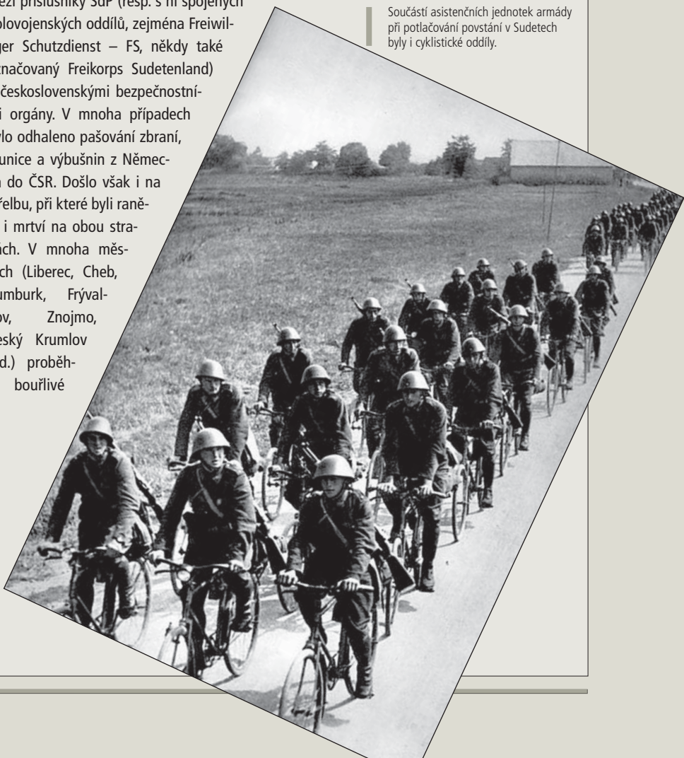
Součástí asistenčních jednotek armády při potlačování povstání v Sudetech byly i cyklistické oddíly.

Zatímco v evropských metropolích probíhala diplomatická jednání, v československém pohraničí se již bojovalo. V průběhu září 1938 výrazně narostlo množství incidentů mezi příslušníky SdP (resp. s ní spojených polovojenských oddílů, zejména Freiwiliger Schutzdienst – FS, někdy také označovaný Freikorps Sudetenland) a československými bezpečnostními orgány. V mnoha případech bylo odhaleno pašování zbraní, munice a výbušnin z Německa do ČSR. Došlo však i na střelbu, při které byli raněni i mrtví na obou stranách. V mnoha měsících (Liberec, Cheb, Rumburk, Frývaldov, Znojmo, Český Krumlov atd.) proběhly bouřlivé