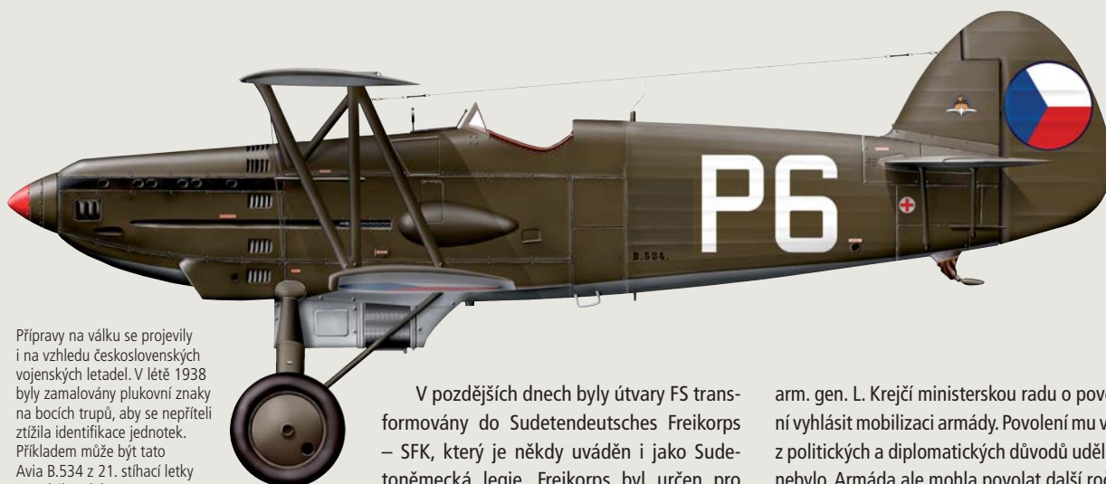
Přípravy na válku se projevíly i na vzhledu československých vojenských letadel. V létě 1938 byly zamalovány plukovní znaky na bocích trupů, aby se nepříteli ztížila identifikace jednotek. Příkladem může být tato Avia B.534 z 21. stíhací letky Leteckého pluku 1.

Násilnosti v pohraničí si vyžádaly rychlý zákrok československých bezpečnostních sil, ale také částí armády. Ta byla okamžitě uvedena do stavu pohotovosti. Na několika místech byla pro zklidnění situace dokonce nasazena i obrněná vozidla (např. obrněná auta vz. 30, tančíky vz. 33 i lehké tanky vz. 35). Účinnost zásahu proti německým bojůvkám však značně omezoval rozkaz, který zakazoval střelbu v těch případech, kdy by mohla dopadat na německé území. K doplnění posádek lehkého opevnění bylo povoláno kolem 118 000 záložníků. Ti projevili skutečně výtečnou morálku, když do 12 hodin od doručení povolávacího rozkazu bylo u svých útvarů již 85 % povolanců. Pro uklidnění situace v pohraničí vláda vyhlásila v 11 okresech stanné právo.