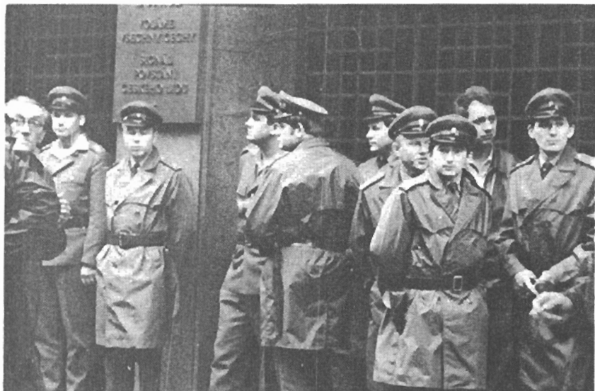
Střežení budovy čs. rozhlasu na Vinohradské třídě příslušníky VB před obsazením