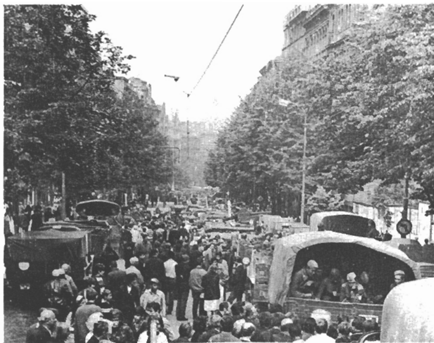
Obsazování Vinohradské třídy