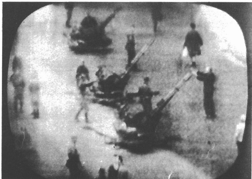
Čs. televize - snímky z obrazovky