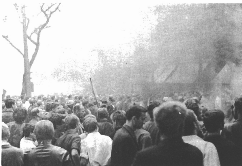
Pražané ráno 21.8.1968 před budovou rozhlasu