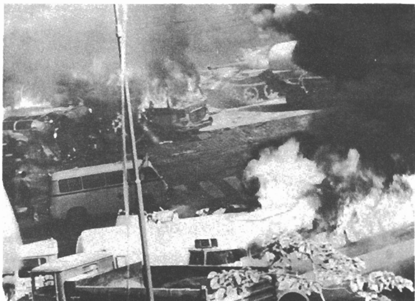
Hořící barikády u rozhlasu