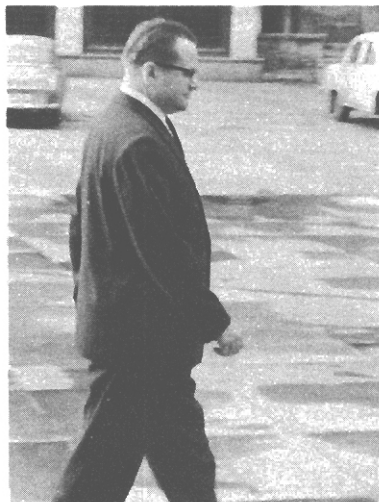
S.I. Červoněnko - sovětský velvyslanec v ČSSR